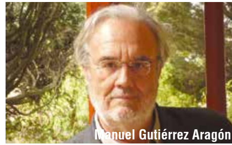
Manuel Gutiérrez Aragón