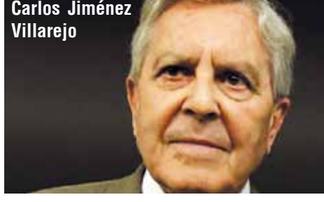
Carlos Jiménez Villarejo